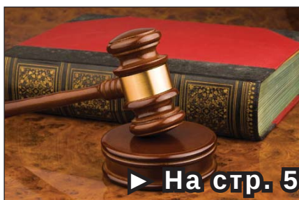
► На стр. 5 Евродокладвам за съдебната система