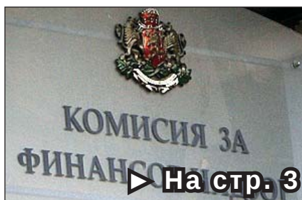
► На стр. 3 Коалицията „Финансов надзор“