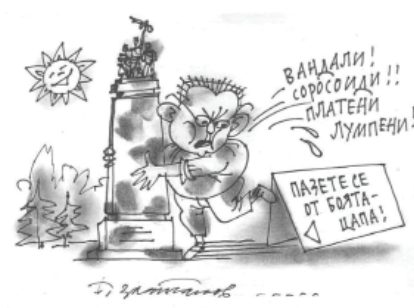
Крикатура: Т. Златанов