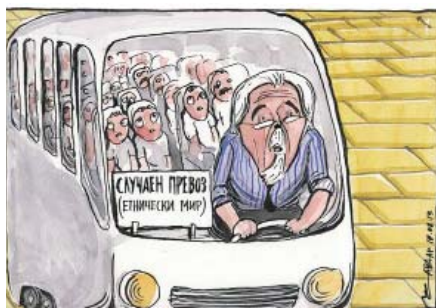
Крикатура: Чавдар Николов