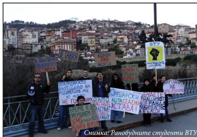
Снимка: Ранобудните студенти ВТУ